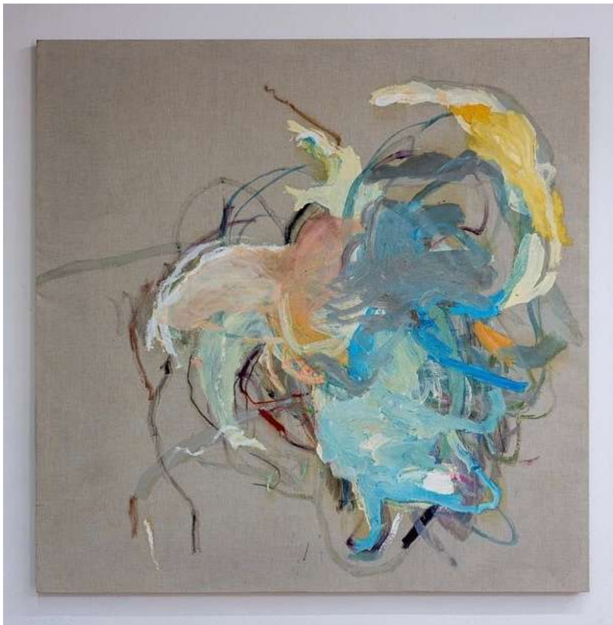
Paesaggio Utopia 2 (2022), olio su tela; 140x140cm. EURO 3.200,00