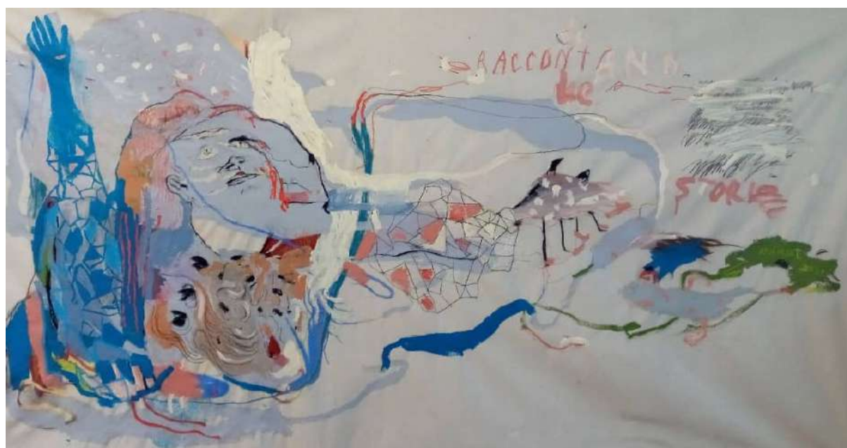
Ci raccontano le storie (2021), tecnica mista su tela; 320x160cm. EURO 6.800,00