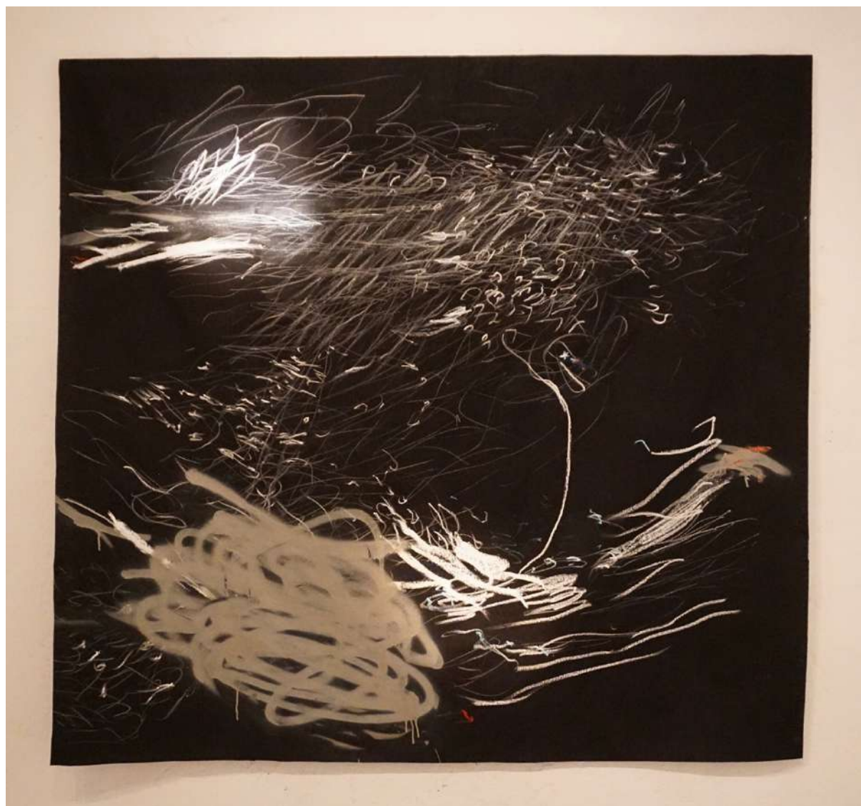
Senza Titolo (2019), tecnica mista su tela; 150x150cm. EURO 3.500,00