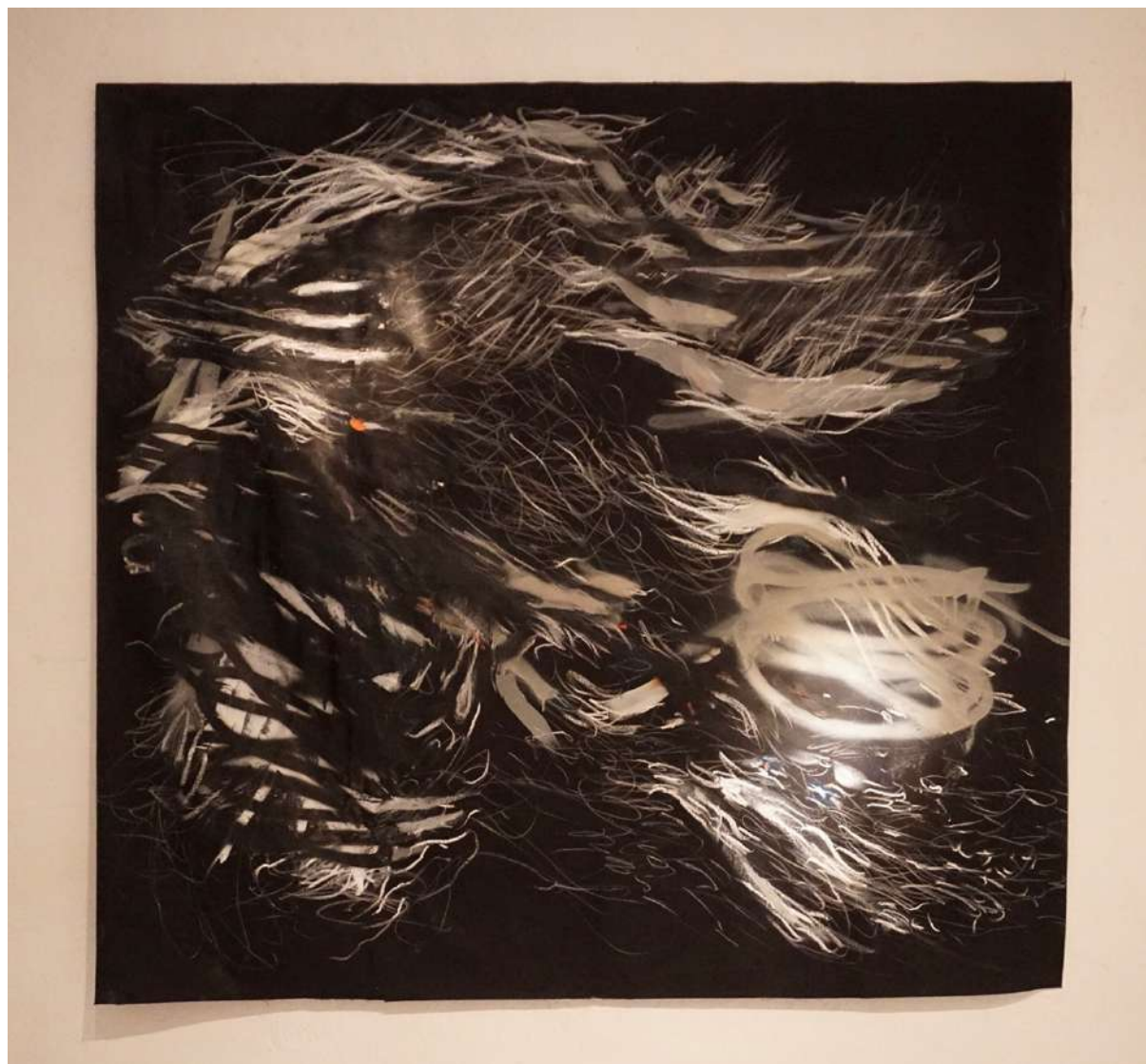
Senza Titolo (2019), tecnica mista su tela; 150x150cm. EURO 3.500,00