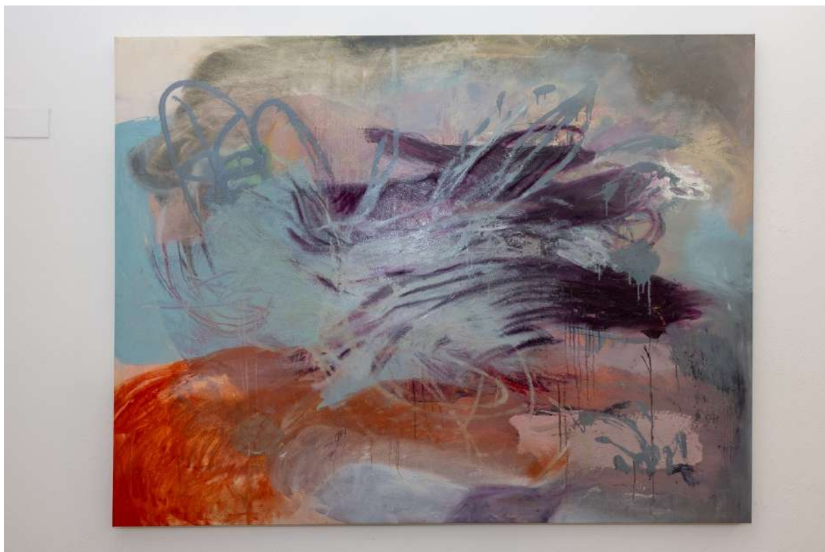
Natura Morta (2021), tecnica mista su tela; 160x130cm. (ON HOLD)