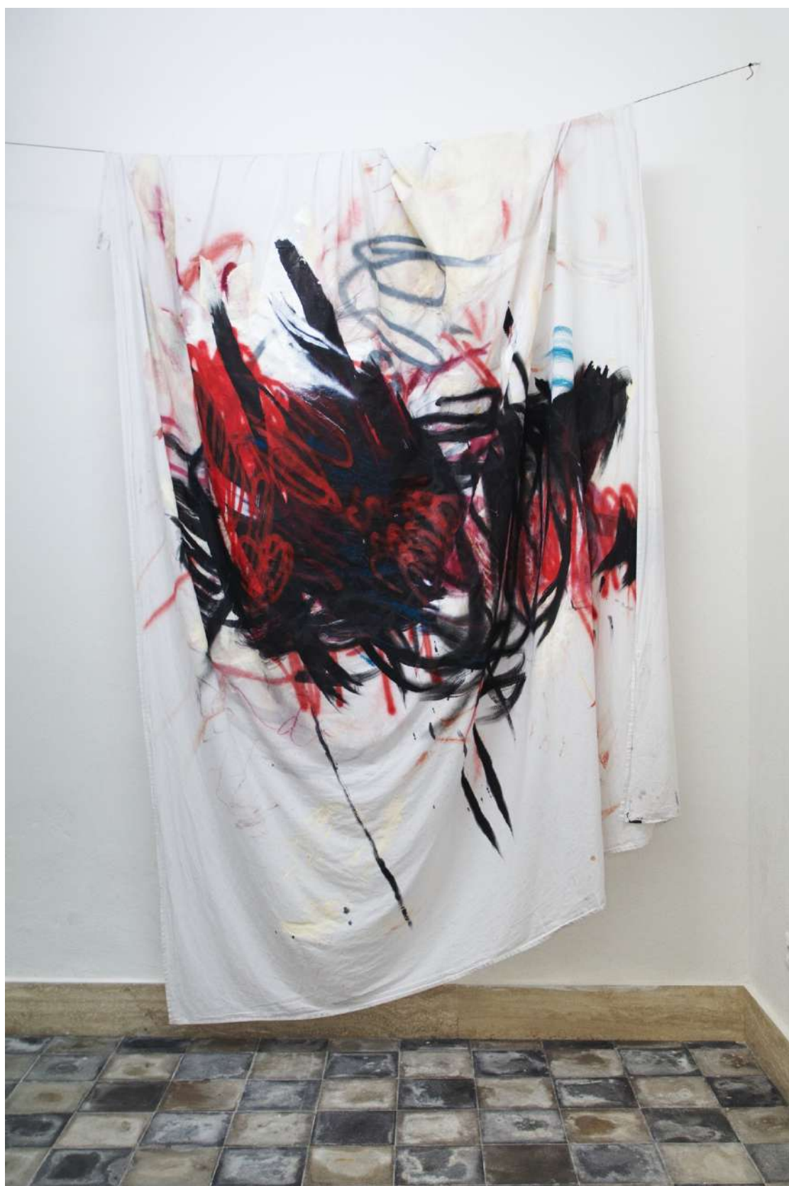
Senza Titolo (2019), tecnica mista su lenzuolo; 220x260cm. EURO 4.800,00