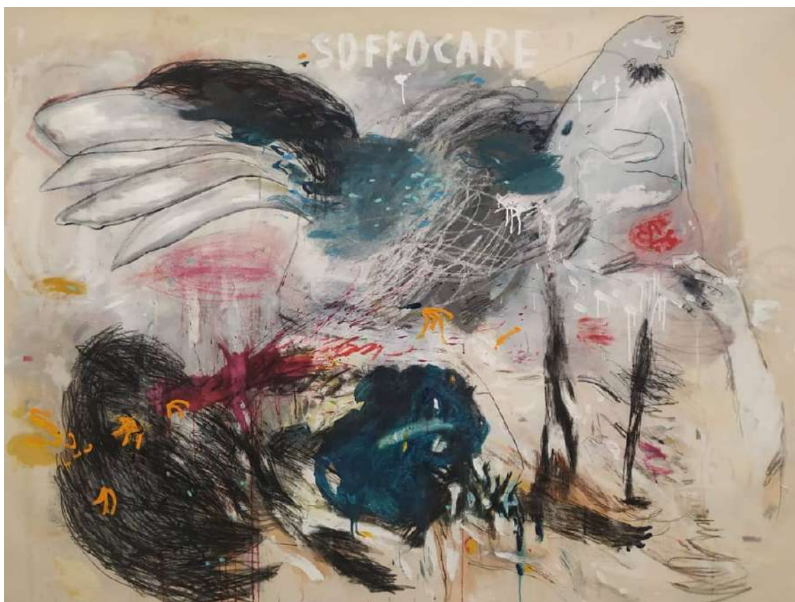
Soffocare (2020), tecnica mista su tela; 180x160cm. EURO 4.200,00 | Finalista Premio Video Insight Foundation 2022