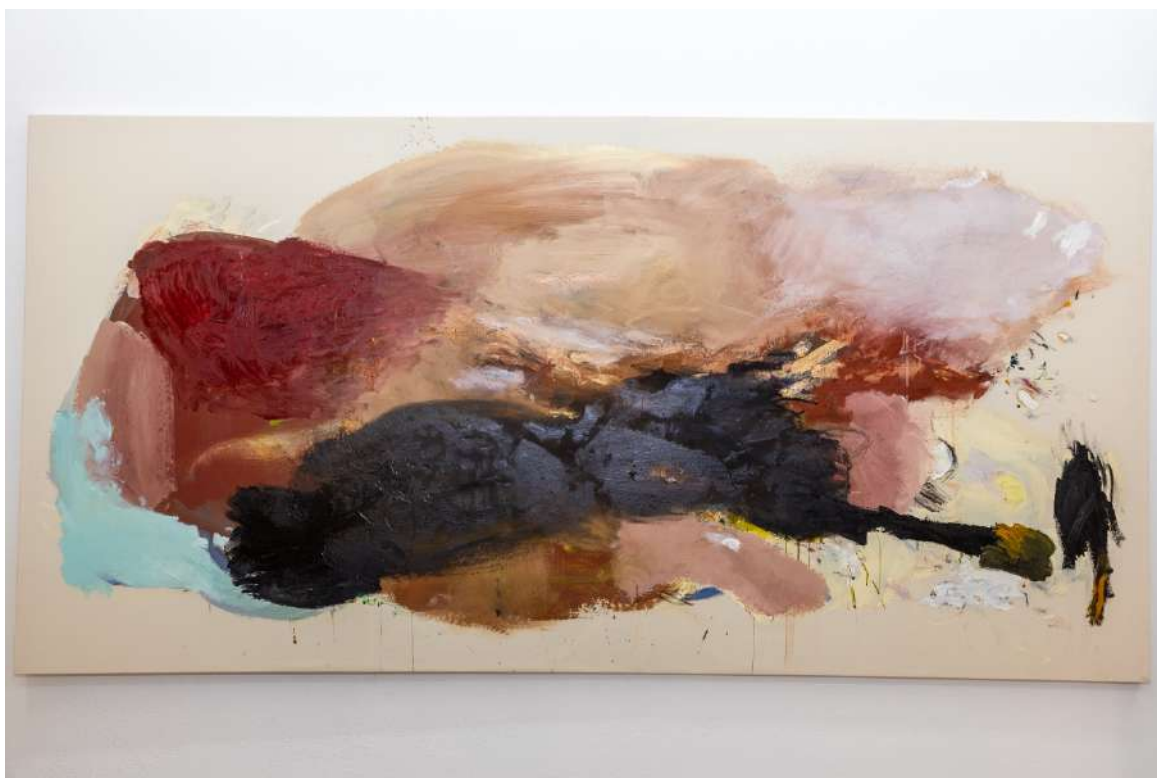
Paesaggio, maggio 2021 (2021), olio su tela; 290x140cm. EURO 6.200,00