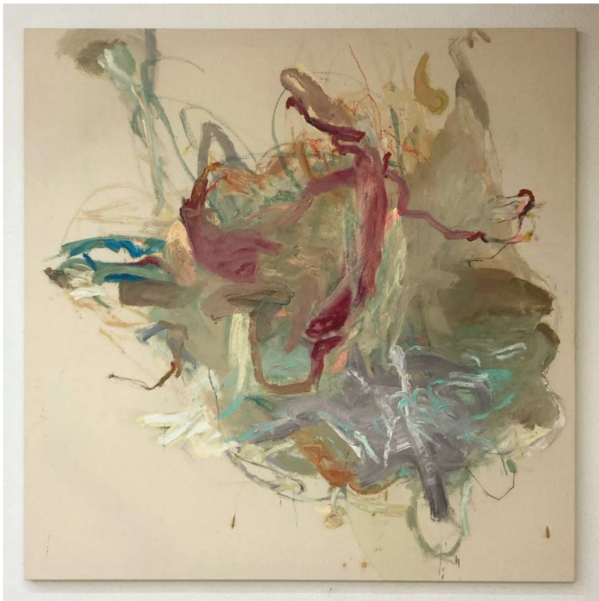
Paesaggio Utopia (2022), olio su tela; 132x132cm. EURO 3.200,00