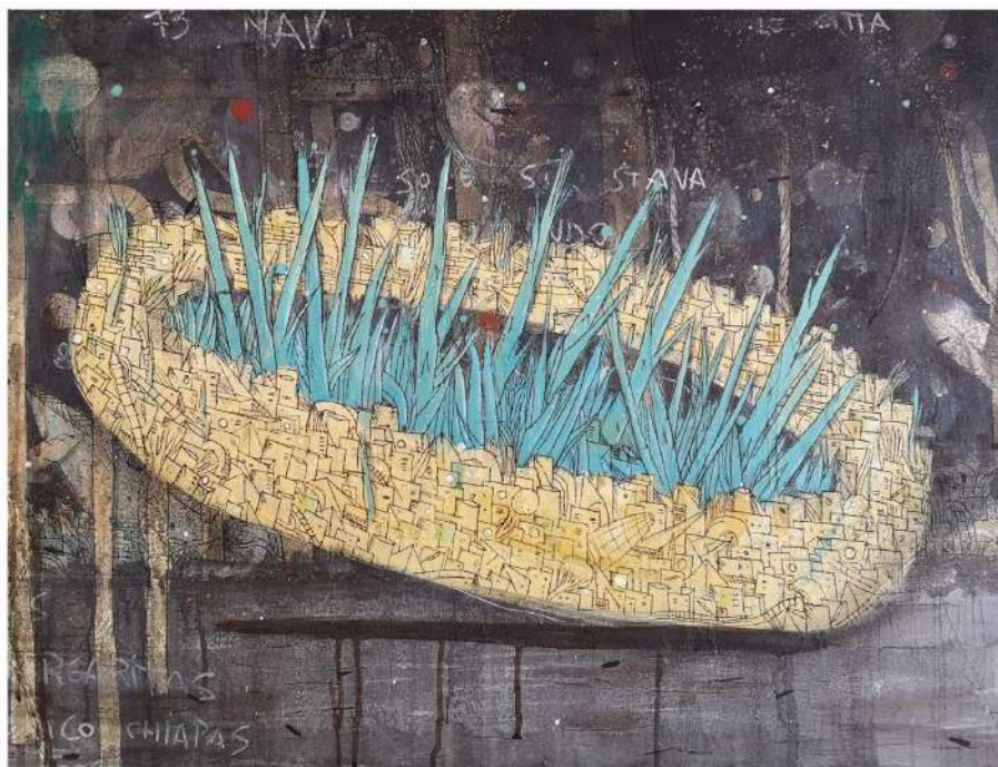
Stava (2014), tecnica mista su tela; 80x60cm. SOLD