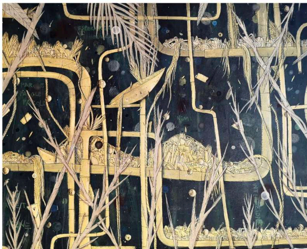
Pluviali (2018), tecnica mista su tela; 100x120cm. EURO 1.850,00