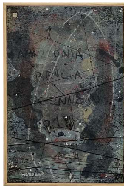
Amazzonia Brucia Gennaio (2020), tecnica mista mattonella; 25x30cm. EURO 350