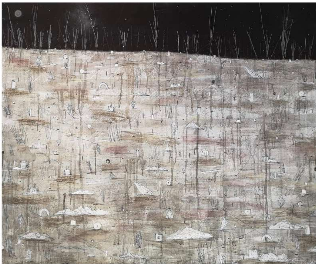
Distesa (2020), tecnica mista su tela; 100x120cm. EURO 1.850,00