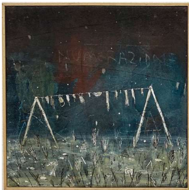
Numerazione (2020) tecnica mista su mattonella; 35x35cm. EURO 450