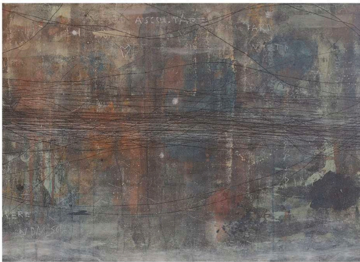
Ascoltare (2020) tecnica mista su tela; 100x70cm. EURO 1.300,00